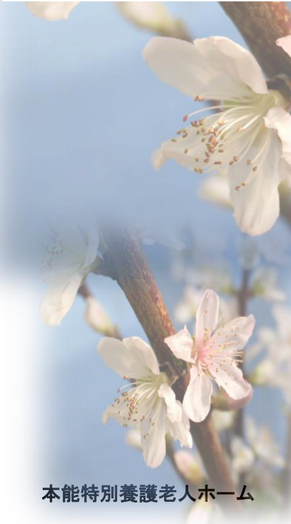
本能特別養護老人ホーム