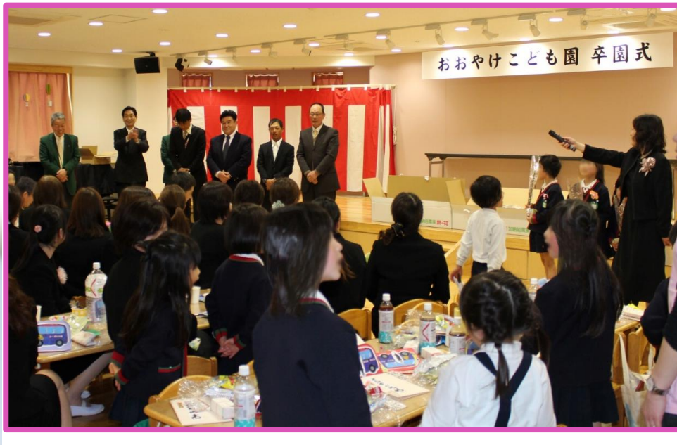
おおやけこども園